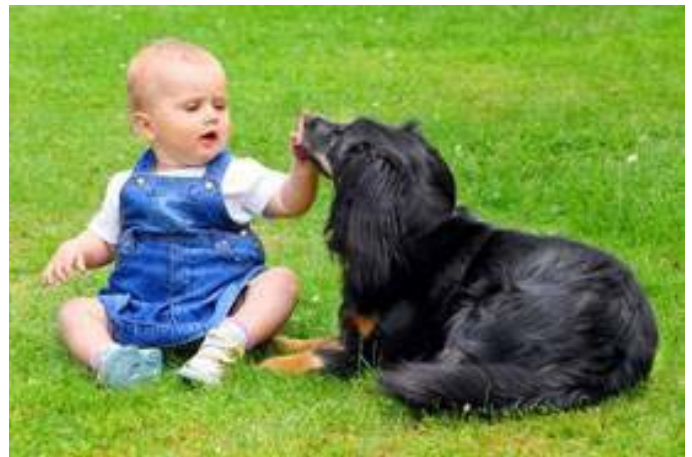
Le chien est le meilleur ami de l'Homme, mais aussi du bébé. Les animaux de compagnie ont prouvé leur intérêt en montrant qu'ils favorisaient globalement le bien-être.

Les auteurs de l'étude expliquent que leur travail diffère des analyses précédentes car il se concentre uniquement sur la première année après la naissance et n'inclut pas d'enfants plus âgés.